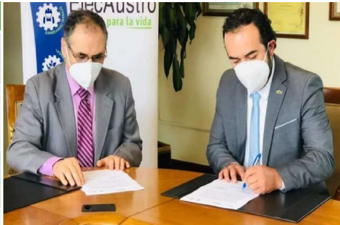
CONVENIO ELECAUSTRO – GADM NABÓN