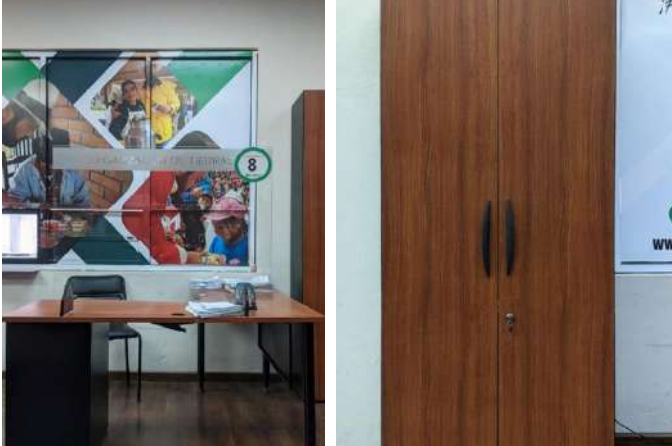
UNIDAD LEGALIZACIÓN DE TIERRAS