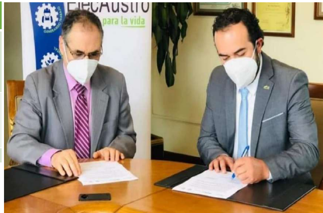
CONVENIO ELECAUSTRO – GADM NABÓN