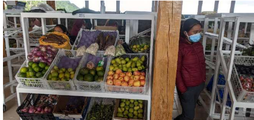
MOBILIARIO PARA EL MERCADO DE LA PAZ