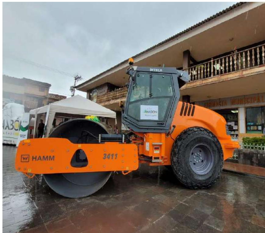
ADQUISICION DE RODILLO LISO VIBRATORIO