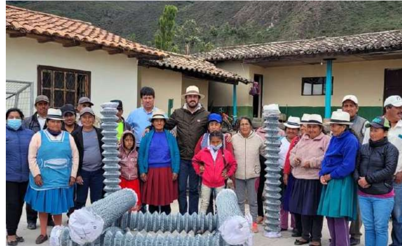
LA MERCED – EL PROGRESO